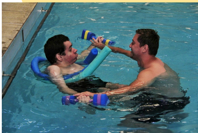
Figura 19 - Estimulação Aquática