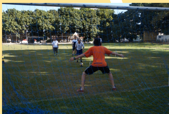
Figura 14 - Futebol

Nessas modalidades a finalidade do processo ensino e aprendizagem é que pessoas com deficiência intelectual possam utilizá-las como instrumento educativo e socializador, estimulando o senso coletivo, a criatividade, a persistência e motivação para a prática esportiva. Além disso, essas modalidades trazem melhorias para a flexibilidade, coordenação motora, agilidade e concentração, consequentemente, contribuindo para melhorar a qualidade de vida.