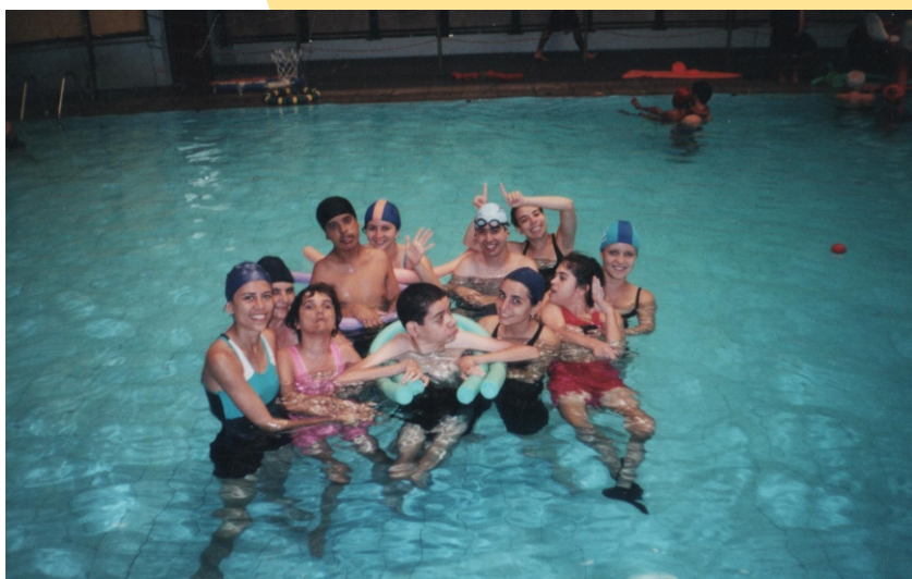
Figura 5 - Natação

Em meados de 1984, cerca de 200 pessoas diretas e indiretas participavam das atividades e o grupo que inicialmente era composto por deficientes físicos, muitos associados da Associação de Paraplégicos de Uberlândia (APARU), passou a compor-se dos associados da Associação dos Deficientes Visuais do Triângulo Mineiro (ADVITRIM) e da Associação dos Cegos de Uberlândia (ASSOCEGU), hoje Associação dos Deficientes Visuais de Uberlândia (ADEVIUDI).