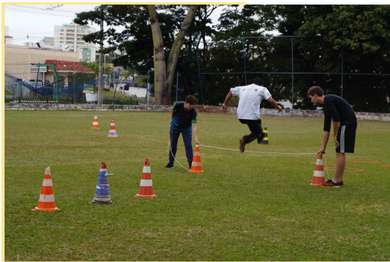
Figura 12 - Fundamentos do atletismo

O atletismo desenvolve habilidades motoras básicas (correr, saltar, lançar) essenciais ao desenvolvimento de outras modalidades esportivas. Contribui para a melhoria da coordenação corporal geral, das capacidades físicas, principalmente, em relação ao sistema cardiovascular e colabora para melhorar o desempenho nas atividades de vida diária.