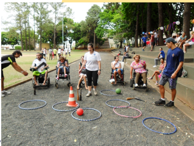
Figura 24- Atividades adaptadas para o atletismo

A recreação perpassa praticamente todas as atividades propostas. Essa abordagem pedagógica tem como objetivo desenvolver capacidades sociais e corporais por meio de jogos e brincadeiras, utilizando diversos materiais, compatíveis com as potencialidades dos alunos.