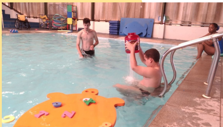
Figura 18 - Estimulação Aquática

A água, em geral, é um excelente meio de relaxamento e execução de movimentos. As atividades aquáticas favorecem o desenvolvimento de pessoas com deficiência, estimulando sua consciência e coordenação corporal, equilíbrio e domínio dos fundamentos básicos dos estilos de nadar.