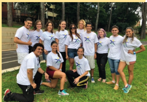
Figura 10 - Equipe Professores e Monitores

P articipam do PAPD cerca de 200 pessoas com diferentes tipos de deficiência e idade variando entre seis meses e setenta e cinco anos.