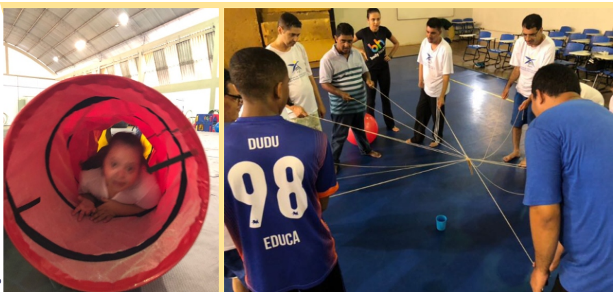
Figura 20 / 21 - Atividades Psicomotoras

N a Psicomotricidade, a ênfase é no desenvolvimento e habilidades básicas perceptivas, movimentos básicos fundamentais, expressão corporal, comunicação não verbal, conceitos concretos e abstratos. Por meio de situações variadas, de acordo com as necessidades e capacidades do aluno, utilizam-se recursos materiais e diversas brincadeiras, para explorar de forma lúdica a criatividade, estimulando o desenvolvimento da criança e do adolescente, promovendo também o desenvolvimento das funções intelectuais.