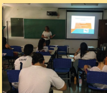
Figura 33 - Curso Natação Infantil

Os cursos de extensão tem por objetivo ampliar a formação inicial e continuada na área da educação física. São ministrados por profissionais qualificados e que abordam diferentes temas, tais como: natação, recreação, planejamento, psicomotricidade, múltiplas inteligências.