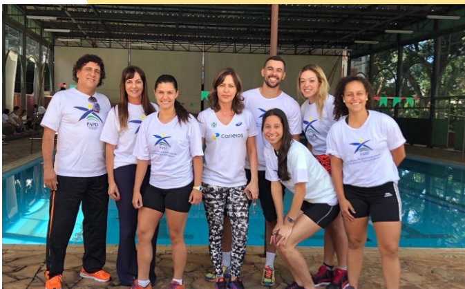
Figura 11 - Equipe Professores e Monitores

avaliação semestral dos aspectos motores, cognitivos e sócioafetivos dos/as alunos/as com deficiência.