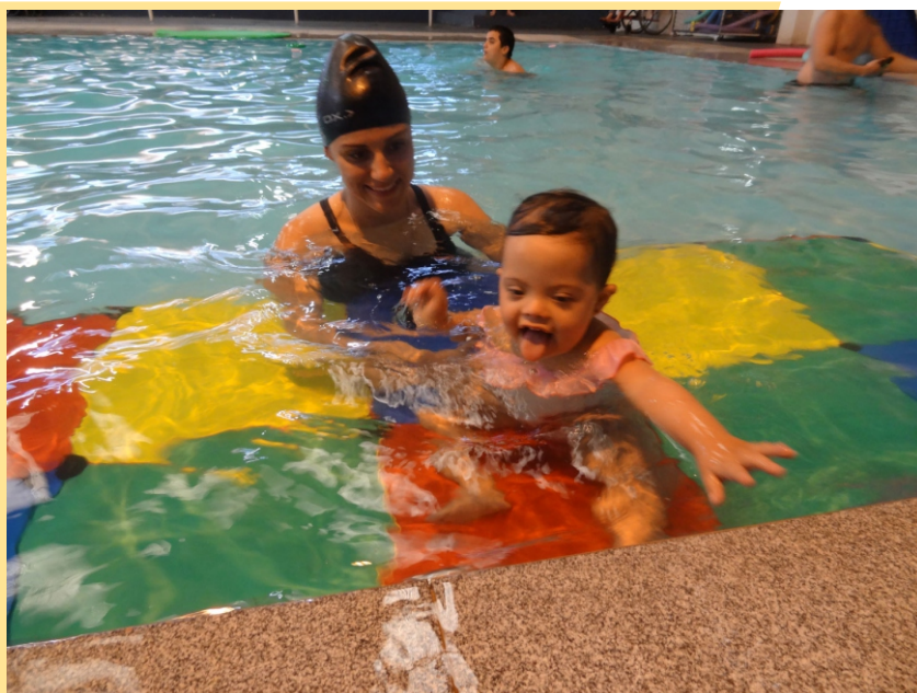
Figura 6 - Natação Infantil

D urante muitos anos, esse programa foi denominado Programa de Atendimento à Pessoa com Deficiência. Em 2012, quando completou trinta anos, os profissionais nele envolvidos entenderam ser mais adequado que ele se denominasse: PROGRAMA DE ATIVIDADES FÍSICAS, ESPORTIVAS E DE LAZER PARA PESSOAS COM DEFICIÊNCIA (PAPD).