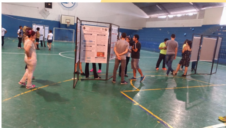
Figura 31 - Painel

Essa atividade oportuniza reflexão a respeito do processo realizado e dos resultados obtidos nas vivências ao longo do semestre.