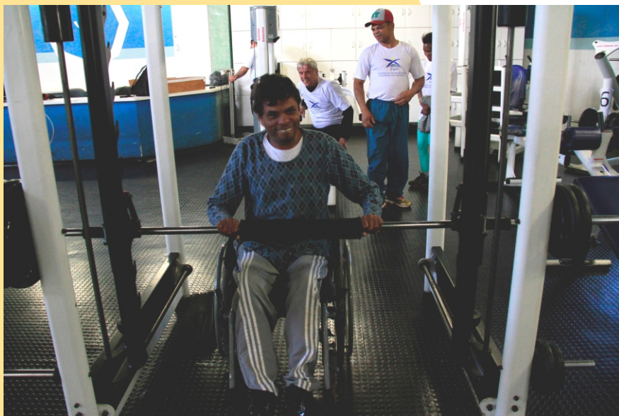
Figura 17 - Musculação