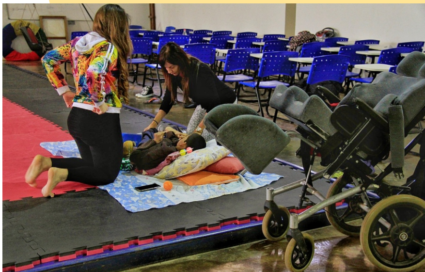
Figura 22 - Atividades Psicomotoras