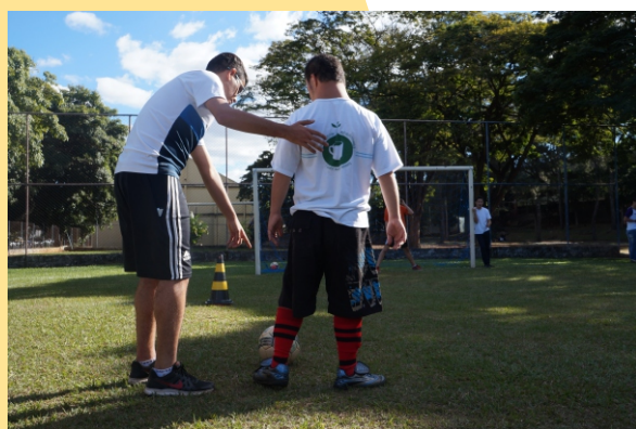
Figura 8- Futebol

E m conformidade com as ações de extensão da Pró Reitoria de extensão e cultura (PROEXC) da UFU, o PAPD é um programa de extensão que tem por objetivo desenvolver atividades físicas, esportivas e de lazer, com pessoas com deficiência por meio de práticas corporais que auxiliam no processo de reabilitação, interação social e melhoria da qualidade de vida dessas pessoas. O PAPD