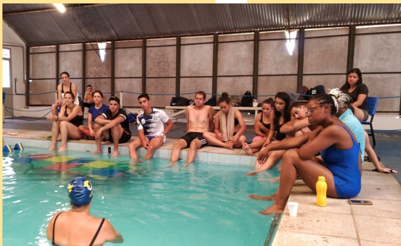
Figura 35 - Curso Natação Infantil