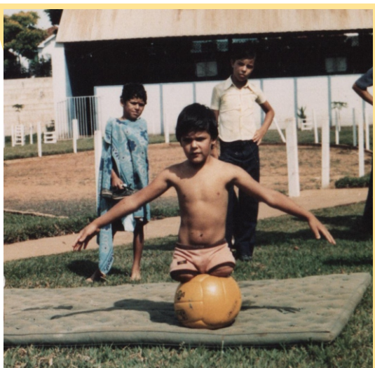
Figura 3 - Primeiros participantes do PAPD

Novos/as alunos/as, cada um/a com a sua especificidade de deficiência, foram incorporando-se ao grupo e continuou crescente a demanda por vagas no projeto denominado macrociclo de treinamento aplicado ao deficiente físico”.