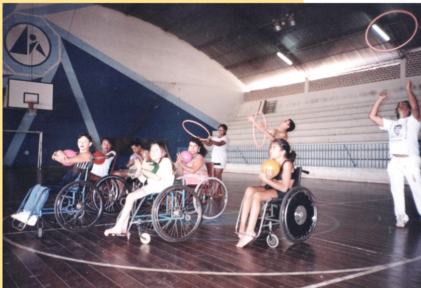
Figura 1 - Iniciação ao atletismo

O trabalho com pessoas com deficiência, na Faculdade de Educação Física da Universidade Federal de Uberlândia (FAEFI/UFU) teve início em meados de 1982, com três crianças com deficiência física, alunas/os das escolinhas de iniciação esportiva do curso de Educação Física as quais eram destinadas, principalmente, aos filhos/as de trabalhadores/as que moravam em bairros da periferia da cidade.