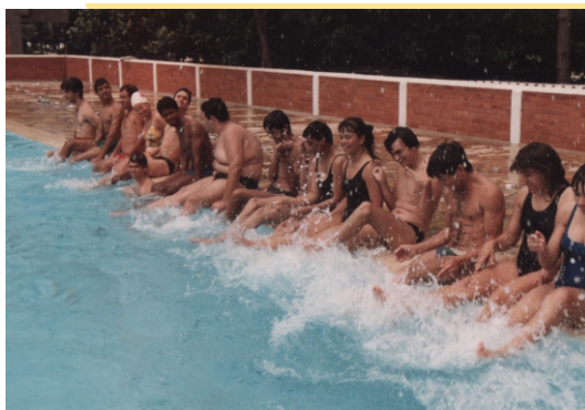
Figura 2 - Iniciação à natação

O trabalho com pessoas com deficiência, na Faculdade de Educação Física da Universidade Federal de Uberlândia (FAEFI/UFU) teve início em meados de 1982, com três crianças com deficiência física, alunas/os das escolinhas de iniciação esportiva do curso de Educação Física as quais eram destinadas, principalmente, aos filhos/as de trabalhadores/as que moravam em bairros da periferia da cidade.