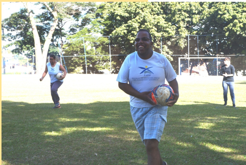
Figura 23 - Recreação

A recreação perpassa praticamente todas as atividades propostas. Essa abordagem pedagógica tem como objetivo desenvolver capacidades sociais e corporais por meio de jogos e brincadeiras, utilizando diversos materiais, compatíveis com as potencialidades dos alunos.