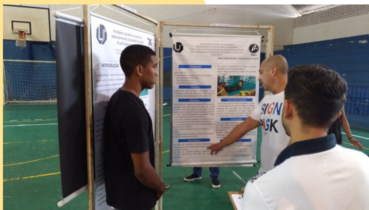
Figura 32 - Painel