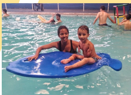
Figura 34 - Curso Natação Infantil