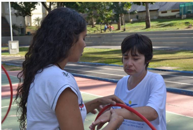
Figura 7 - Estimulação Psicomotora

D urante muitos anos, esse programa foi denominado Programa de Atendimento à Pessoa com Deficiência. Em 2012, quando completou trinta anos, os profissionais nele envolvidos entenderam ser mais adequado que ele se denominasse: PROGRAMA DE ATIVIDADES FÍSICAS, ESPORTIVAS E DE LAZER PARA PESSOAS COM DEFICIÊNCIA (PAPD).