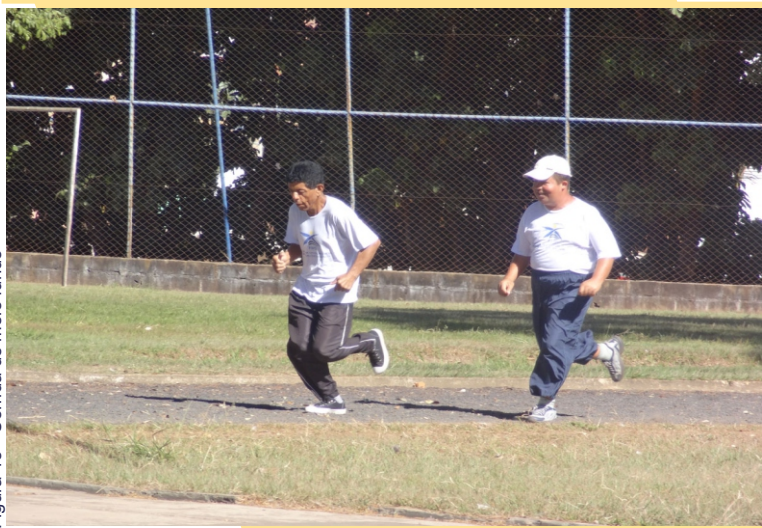
Figura 13 - Corrida de meio fundo