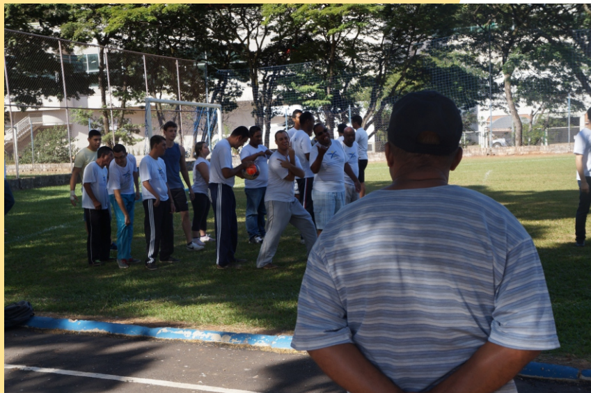
Figura 9 - Atividades em grupo

E m conformidade com as ações de extensão da Pró Reitoria de extensão e cultura (PROEXC) da UFU, o PAPD é um programa de extensão que tem por objetivo desenvolver atividades físicas, esportivas e de lazer, com pessoas com deficiência por meio de práticas corporais que auxiliam no processo de reabilitação, interação social e melhoria da qualidade de vida dessas pessoas. O PAPD