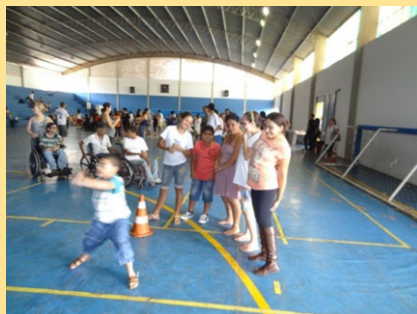
Figura 28 / 29 - Confraternização