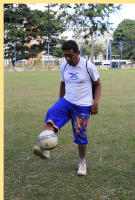
Figura 15 - Futebol